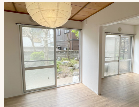
DIY型空き家リノベーション事業登録物件。DIY実施前(写真上)、DIY実施後(同下)

また、市では、空き家を「負の遺産」ではなく「地域資源」として活用する「空家バンク事業」や、「DIY型空き家リノベーション事業」を実施。空き家の活用を促進することで、安全で住みよいまちの実現につなげています。このほか、空き家の活用や解体、相続の相談に応じる「空き家無料相談会」も実施。適切な管理がされない空き家発生予防に取り組んでいます。