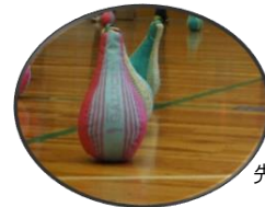
ダーマ 先の細い部分をもって投球します。

今大会では1試合で90点を超えるチームもあり、とてもハイレベルな試合も見られ、良い大会となりました。