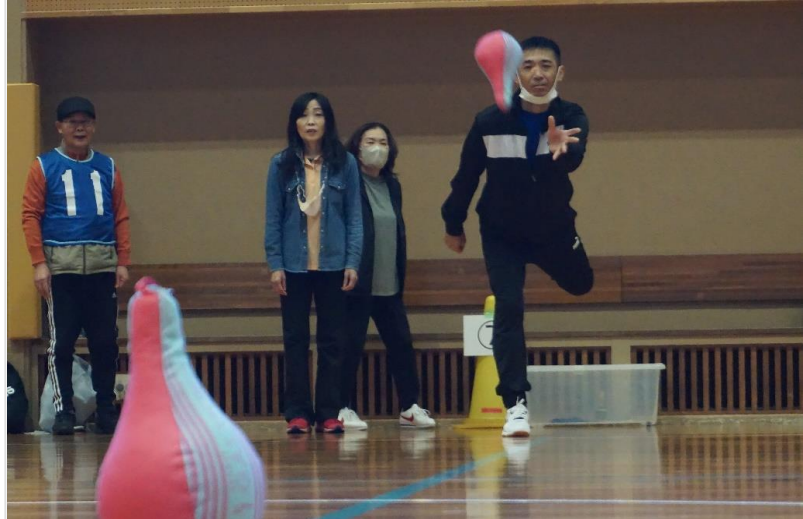
軽スポーツ大会(ガラッキー)11/11

発行:各務原市スポーツ推進委員広報部 お問い合わせ: 各務原市教育委員会事務局スポーツ課 TEL:058-383-1231