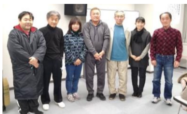
スポーツ推進委員会 推進委員役員一同

南のほうからは花の便りも聞かれるようになり、やわらかな日ざしが心地よく感じられる季節になりましたが、いかがお過ごしでしょうか。