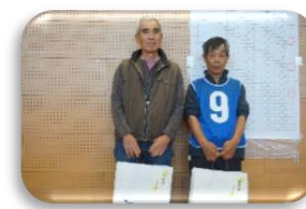
2 鵜沼三 ひまわり