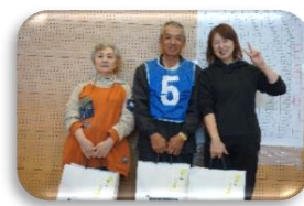
3 稲羽西 なかよし