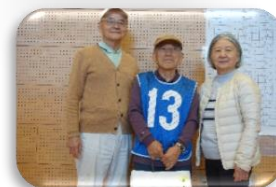
1 八木山 つつしが丘 シニアクラブ