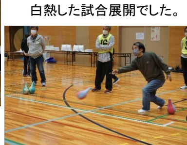
白熱した試合展開でした。