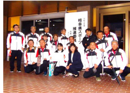
岐阜県スポーツ推進委員研究大会 プリニーの市民会館にて 各務原市スポーツ推進委員