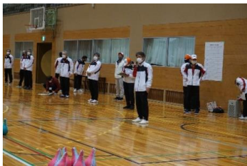
開会式 副会長挨拶