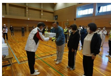
表彰式 おめでとうございます！